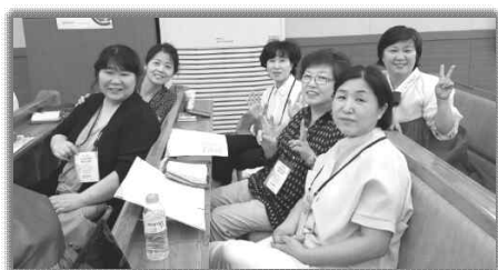
전국어전도회연합회 수련회 (8.17~18)