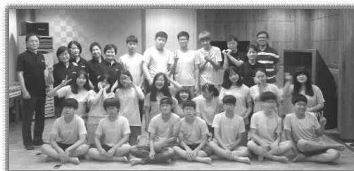
중고등부 자체수련회 (8.14~15)