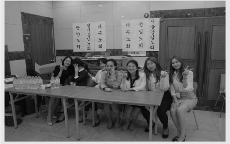
대한예수교장로회 제101회 정기총회 (9.19)