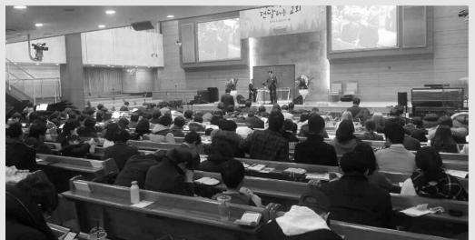
선교주일 : 정회권 선교사 설교, 이종우 선교사 설교, 선교국 헌신예배 (2.19)