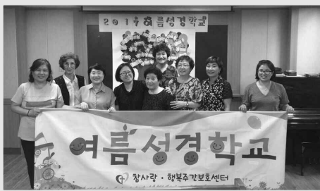
사랑부 여름성경학교 (8.10)