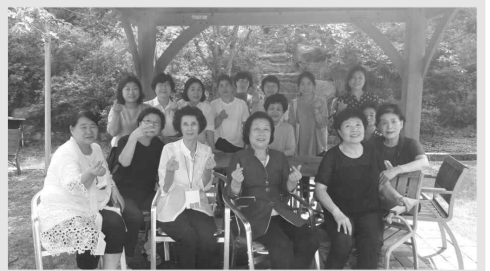
전국 여전도회연합회총회 및 수련회 (8.21~22)