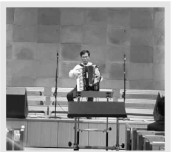
참사랑교회 창립 51주년 찬양대 헌신예배(9.16)