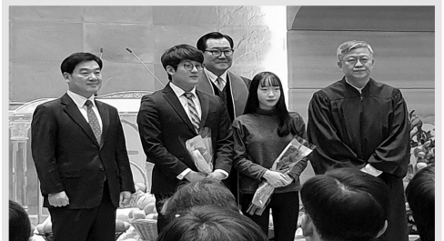
추수감사주일 & 세례식(11.18)