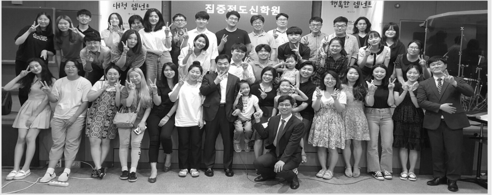
제1기 대학청년부 집중전도신학원 (7.21)