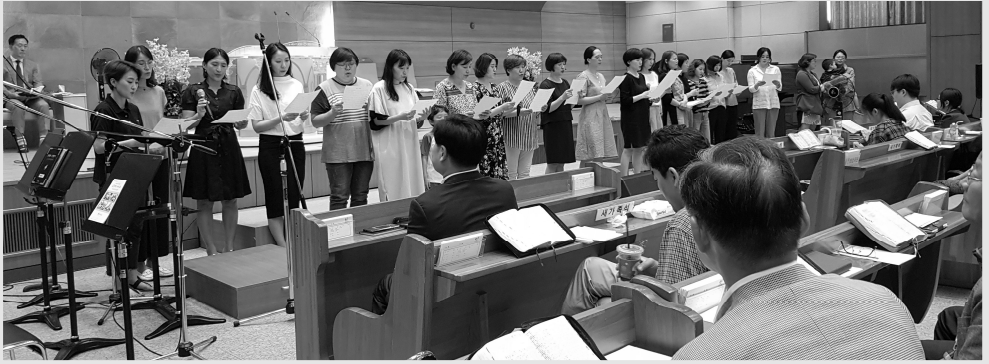
제4, 5, 6여전도회 헌신예배 (7.21)