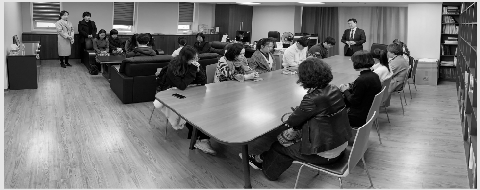
수험생 축복기도회 (11.10)