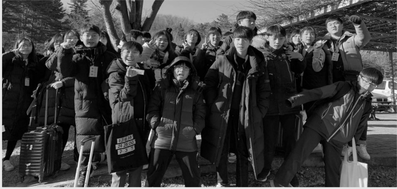
세계청소년수련회 (1.13~15, 덕평 RUTC)